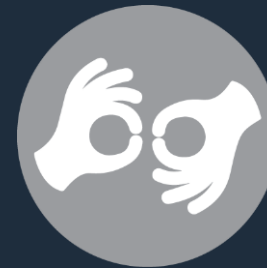
Lengua de Señas